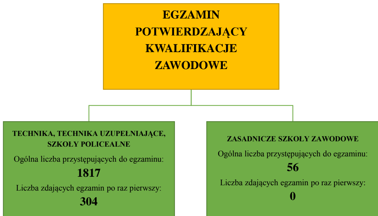
Schemat 1. Liczba absolwentów przystępujących do egzaminu zawodowego w 2016 roku

Liczbę absolwentów, którzy przystąpili do egzaminu zawodowego przedstawiono na schemacie 1.