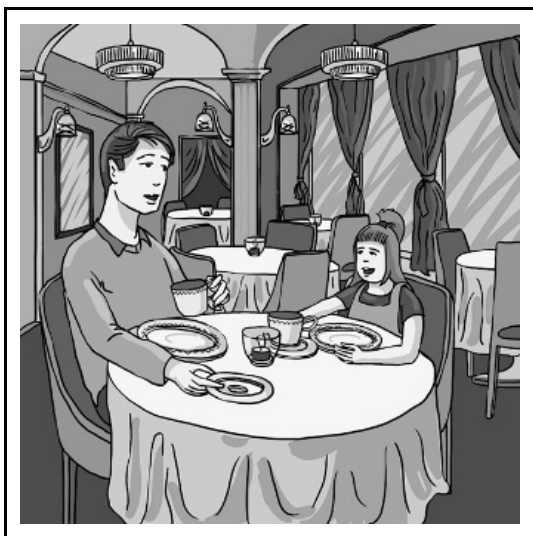
tata i córka w restauracji