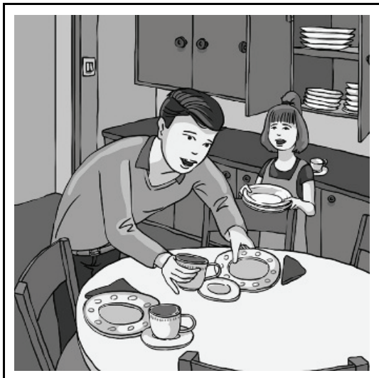
tata i córka w kuchni